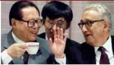
早前的江澤民-基辛格

基辛格於2014年4月8日在美國亞洲協會政策研究所成立儀式上避無可避、忍不住口地說：“江澤民在就任之初被外界大大低估了...”！到底他的“什麼能力”被低估了什麼？